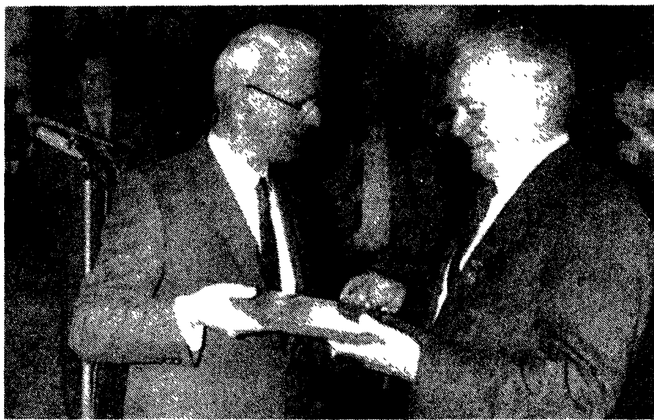
Während der Überreichung der hohen Auszeichnung an Nikolai Tichonow.

WASHINGTON (ADN/SZ). 8,5 Millionen Werktätige waren im Juli in den USA als Arbeitslose registriert, teilte das Arbeitsministerium in Washington am Freitag mit. Damit ist die Arbeitslosenquote mit 7,3 Prozent seit Februar dieses Jahres unverändert hoch. Die Zahl der Entmutigten, die die Suche nach Arbeitsplätzen als aussichtslos aufgegeben haben, betrug nach dem letzten Stand 1,1 Million. 5,6 Millionen Werktätige mußten sich aus – wie es heißt – „ökonomischen Gründen“ mit Kurzarbeit und damit drastisch beschränktem Einkommen begnügen. Unter Jugendlichen ist die Arbeitslosigkeit erneut angestiegen.